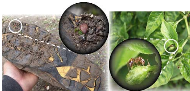
靴の裏に付いた植物の種

また、衣類や靴裏にも付着していたり、他の地域で買った鉢植えなどの園芸品に紛れ込んでいるなど、気づかないうちに、虫や植物の種などが持ち込まれてしまう場合もあります。