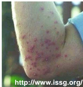
外来種ヒアリに刺された跡

毒などをもつ外来種にかまれたり刺されることによって、アレルギー反応や病気にかかることもあります。